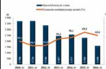
Összes bűncselekmény az ENYÜBS 2010–2016. évi adatai alapján Szombathelyi Rendőrkapitányság

dési helyzet indokolta. A bűnmegelőzési tanácsadók rendszeresen részt vettek tanórákon, iskolai rendezvényeken az intézmények meghívására.