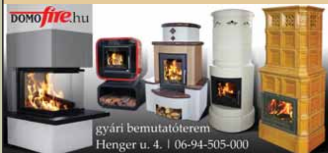
gyári bemutatóterem Henger u. 4. | 06-94-505-000