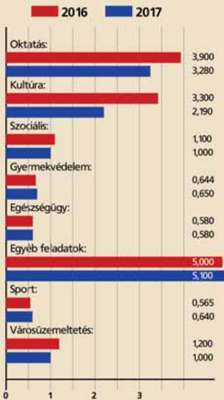
MŰKÖDÉSI KIADÁSOK (milliárd Ft)

az MSH, a vásárcsarnok vagy éppen a város háza felújítását, és saját erőből finanszírozzák az esetleges önrészeket vagy a pályázati pénzből finanszírozott beruházásokhoz kapcsolódó kisebb munkálatokat. A közgyűlés tavalyi döntése alapján az idén félmilliárd forintot terveztek út- és járdafelújításra, amit saját forrásból biztosít a költségvetés.