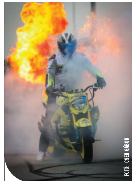
© Cseh Gábor / Vas Népe – Lánglovag