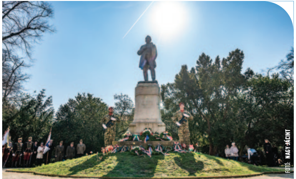
© A Savaria Múzeum kertje volt az egyik helyszíne a városi ünnepségeknek

– És mégis, amikor a felhangzott a kérdés, és hívott a haza, akkor senkinek se volt drágább a rongy élete, mint a haza becsülete. S ugyanígy mennék ma is, mert létezik olyan dolog, ami a személyes sorsnál is fontosabb, és mindent felülír. A méltóságunk, a gyökereink, a nagyobb közösségünk összetartó ereje, a belső és külső