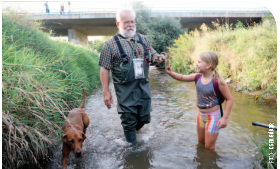
© Cseh Gábor – Újra elvadulni

A fotósok után a város által alapított Szombathelyért Sajtódíj kitüntetését adták át. Ez olyan