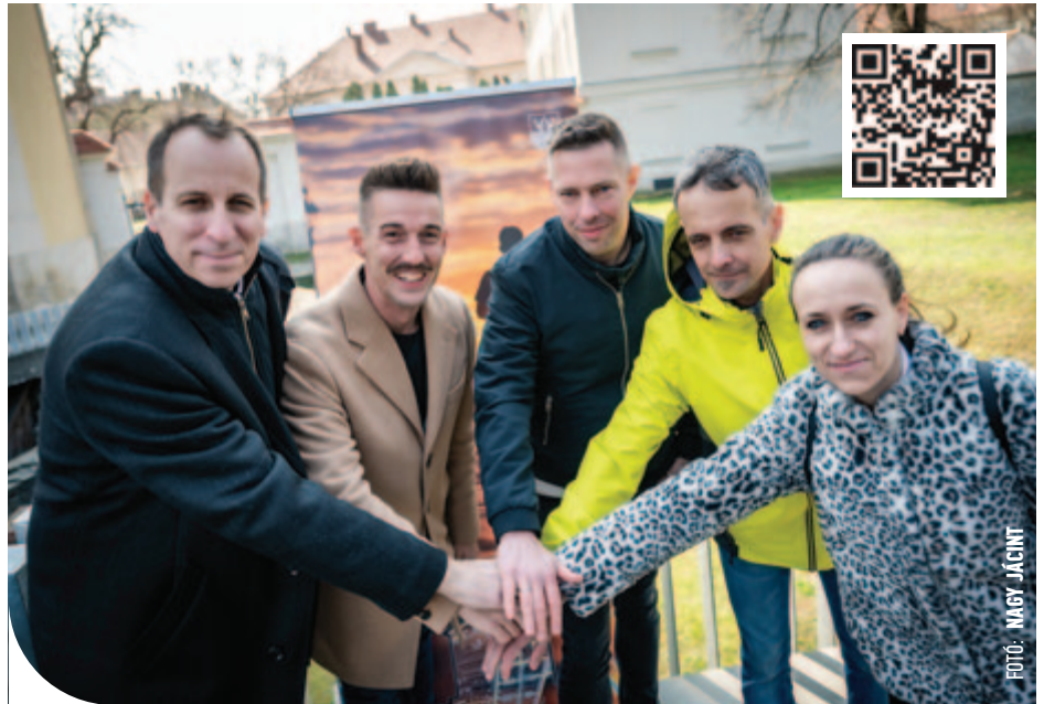
A Romkertben tartott sajtótájékoztatót ismertették az augusztus végi rendezvény részleteit