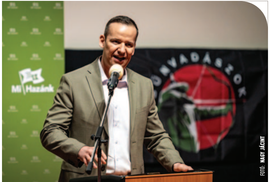
Toroczkai László szerint a két nagy párt rástartolt a Mi Hazánk szavazóira