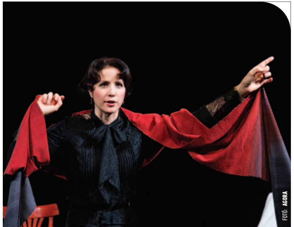
Polcz Alaine-estjét 2018 óta telt házzal játsszák a Tháliában

Ha egy pillanatra is belegondolunk, hogy nem hiába szenvedünk mi sem, ha elhisszük Polcz Alaine-nek, hogy mindennek van oka, és eljön az életben az a pillanat, amikor egyszer csak összeáll a kép, s hogy azért, hogy nem halunk bele az élet adta kihívásokba, hanem