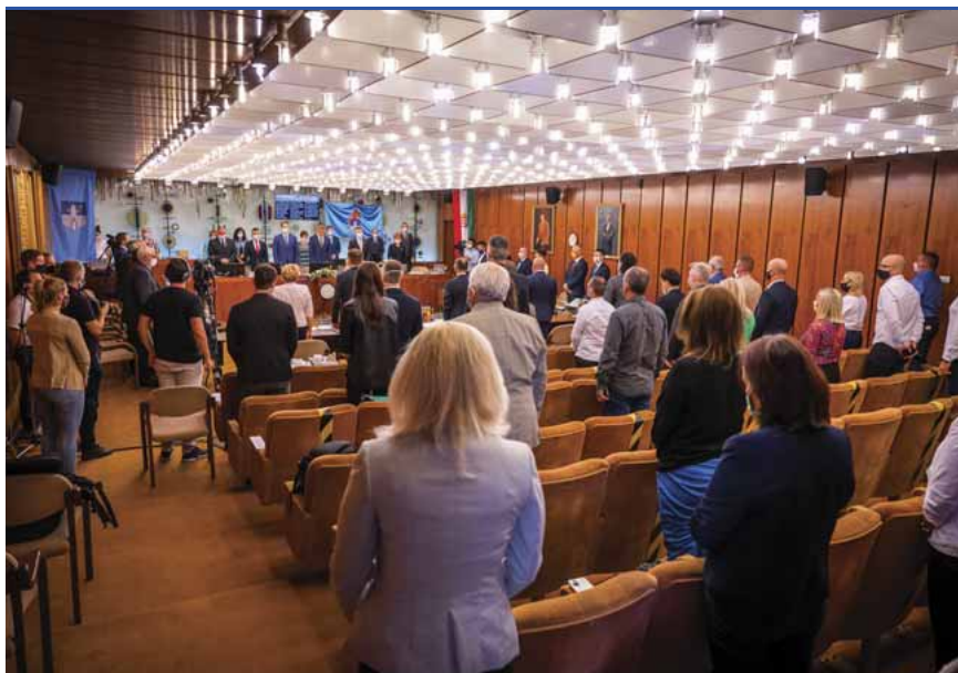
A közgyűlések helyszíne: néha veretes mondatokra ragadtatják magukat a képviselők