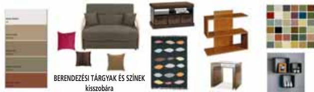
BERENDEZÉSI TÁRGYAK ÉS SZÍNEK kisszobára