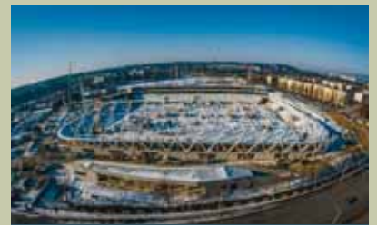
Gőzerővel folyik az építkezés

– Az első évben a feljutás volt a cél Mezőkövesden, bajnokságot nyertünk, jól ment a játék nekem és a csapatnak is. Az NB I-ben a bajnokság elején rendszeresen szerepeltem, majd lebetegedtem, és mire meggyógyultam, Pintér Attila nem változtatott a jó szériában lévő együttesén. Nehéz döntés volt otthagyni Mezőkövesdet, napokig gondolkodtam, örültem, mitévő legyek, és őszintén szólva hazahúzott a szívem. Szeretnék bizonyítani, helyet követelni magamnak a kezdőben – persze tudom, ez nem