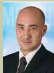
Illés Károly (Fidesz-KDNP)

röskei ház fele, egy 48 négyzetméteres iroda kétharmada (vétél), egy 65 négyzetméteres lakás egynegyede. Gépkocsi: egy Renault Fluence, az ügyvédi iroda tulajdonában. Takarékbetétben van félmillió forintja, de van 2,7 millió forint pénztézeti tartozása is. Jövedelme ügyvédként 165 ezer forint, a Styl Fashion Kft.-től feb-tagként 30 ezer forintot kap. Egy lakberendezési kft. ötven százaléka még az övé.