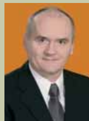
Dr. Hende Csaba (országgyűlési képviselő)

forintot keres. Ingatlan bérleti díjból évi 800 ezer forint folyik be hozzá (a Telenortól), a Savaria Városfejlesztési Kft.-nél feb-tag havi 30 ezer forintért.